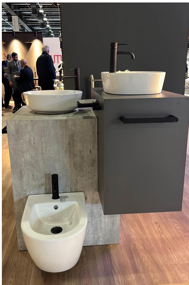
Foto: Accesorios de baño Ergos con la grifería Odisea en acabados negro mate, acompañados de lavabos y bidé de la firma solerbath.

Además, CEVISAMA también ha sido el escenario perfecto para la exhibición de solerbath, la nueva firma de sanitarios y lavabos de Ramon Soler Group . La colección refleja la esencia de la elegancia contemporánea y la funcionalidad excepcional. Los visitantes podían descubrir los lavabos de líneas limpias, inodoros o hasta los bidés de vanguardia.