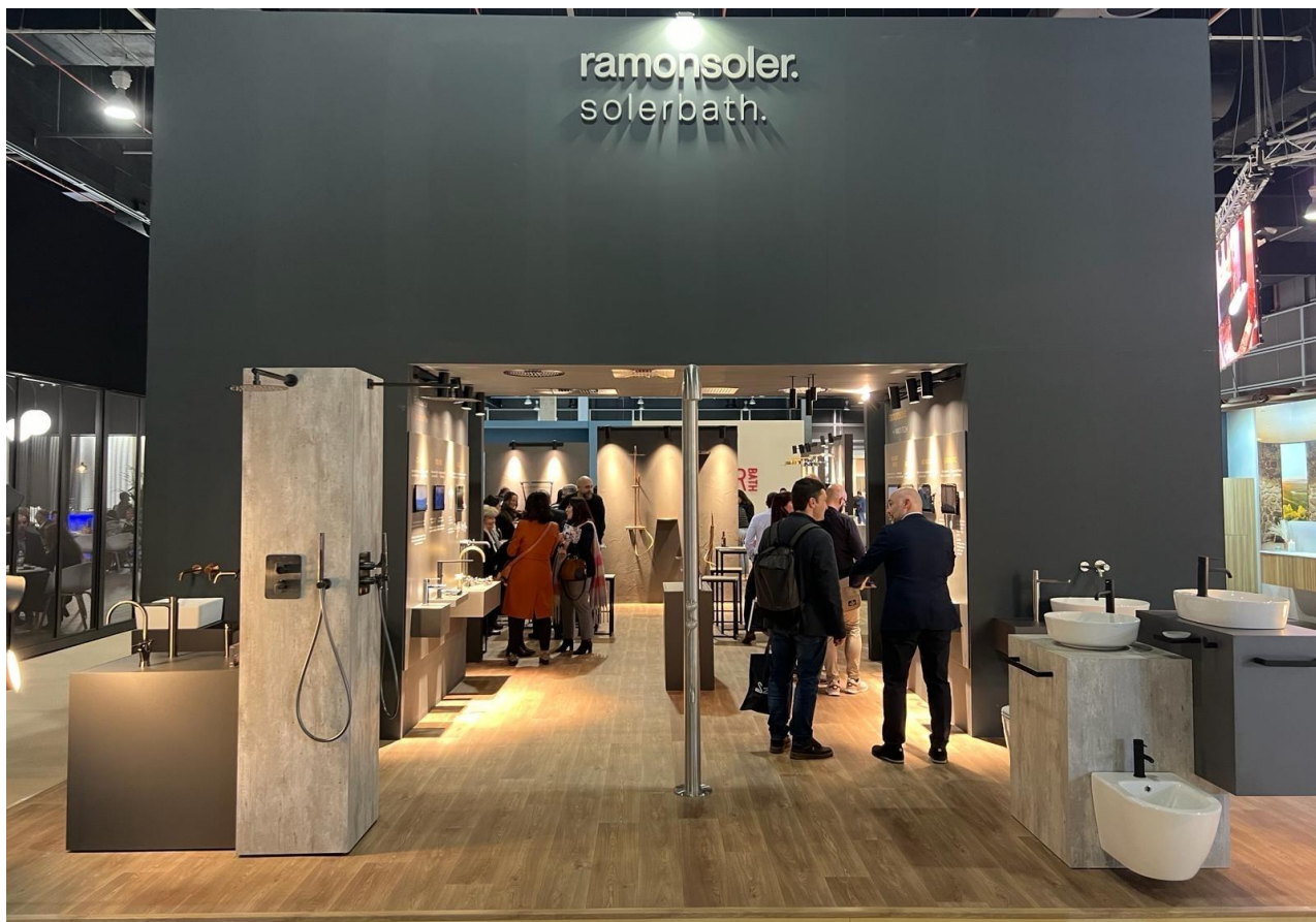
Foto: Stand de ramonsoler y solerbath en CEVISAMA 2024